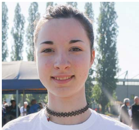
RIVIERA ALICE - Calvatone 60m (9"80) - 60hs (11"82)