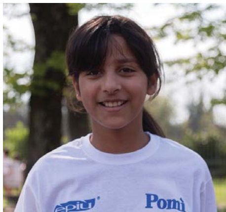
EL ORCHI JASMINE - Casalmaggiore 1000m (3'38"00)- 60m (9"82)