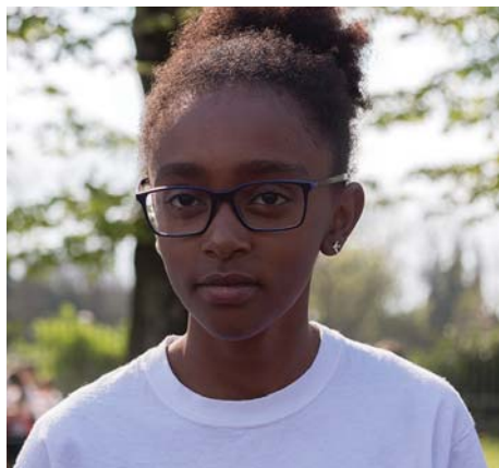
GARATTI MATAWA - Drizzona 1000m (3'42"92)- 60m (9"68)