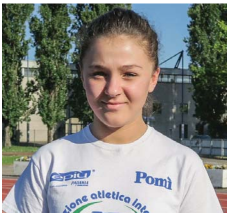
TRIACHINI ASIA - Piadena Marcia (13'35"50) - Vortex (13.06)